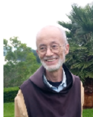
père Oberlin (1963) RD Congo